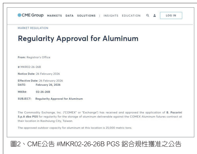
圖2、CME公告 #MKR02-26-26B PGS 鋁合規性獲准之公告

據倉儲業者透露，相關申請是在與CME討論後提出的，該交易所近期曾派代表赴台進行考察倉儲設施以及相關法規。另外，市場人士表示，有別於COMEX銅需要以完稅狀態入到美國境內倉庫，COMEX鋁則採取的是保稅倉庫制度，這點對於美國境外的市場參與者更具有吸引力。