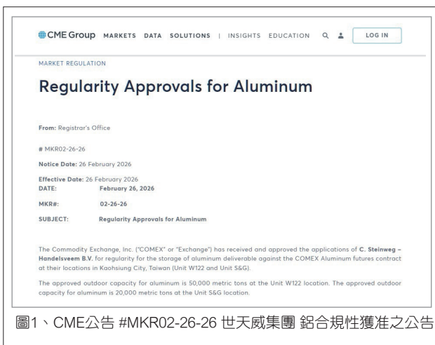
圖1、CME公告 #MKR02-26-26 世天威集團 鋁合規性獲准之公告

交易所指定的上述倉儲據點的鋁錠主要運輸方式均為卡車，且需符合COMEX第7章規則703.B.3.b所規定的每日最低保證出庫率（鋁錠透過主要運輸方式於每營業日達到最低保證出庫率，為總庫存量的2%，且每日的最低出庫量不得低於1,000公噸），並須考量主要運輸指令之前已提交之任何待處理運輸指令，該合格設施在任何時間都需符合上述之規定，並依先到先服務的原則辦理。