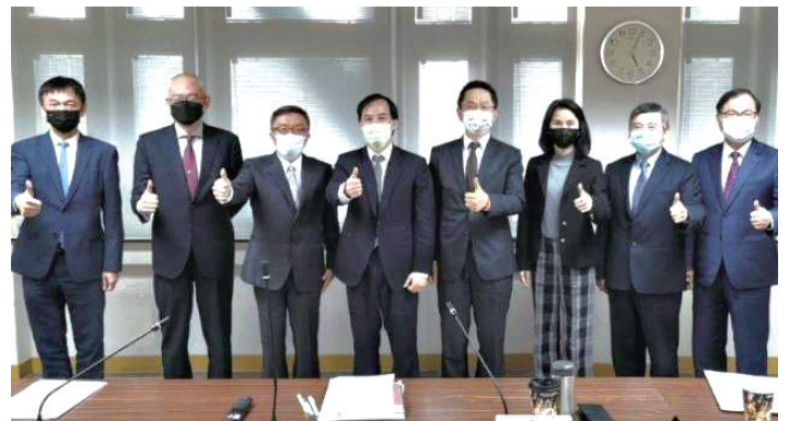
圖說：金管會於3月8日召開記者會發布「證券期貨業永續發展轉型執行策略」，由證期局張振山局長(左3)主持，與三公會理事長及周邊單位首長合影。

本策略之推動，協助證券期貨業能順利轉型，找到風險與機會，及市場定位與商機，以提升整體證券期貨業之國際競爭力。