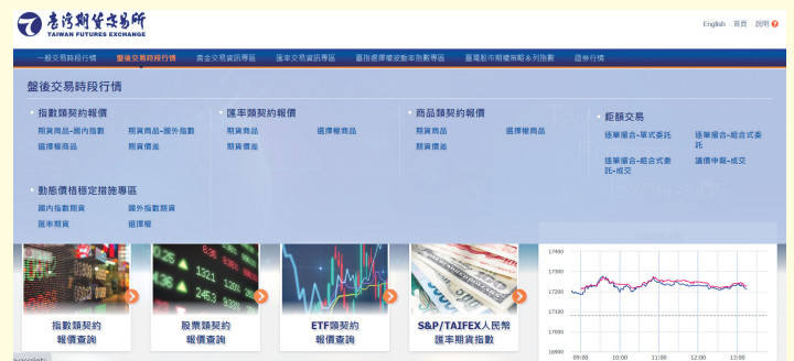
圖2、期交所即時報價行情網址 https://mis.taifex.com.tw/futures/

目前各期貨商皆提供交易人多元的下單軟體及服務，但交易人應了解在使用電子下單交易委託買賣時，可能面對以下風險：如斷線、斷電、網路壅塞或其它不可控制因素，導致所傳送之委託買賣資料無法傳送、接收或報價時間延遲等；另外，在夜盤開盤時與收盤前，因委託簿較薄，價格變動可能較為敏感，若出現大單敲進可能造成短時間內市場價格大幅波動，交易人從事期貨交易，可透過期貨商下單平台或期交所網站取得即時報價資訊，電視台揭示之報價可能有遲延狀況，請交易人特別留意此等狀況，並關注自身委託價格的合理性，謹慎使用各類委託單，避免不必要之風險。