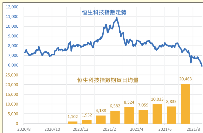
圖說：恒生科技指數波動大，使期貨日均量日益增長 數據來源：香港交易所 每月市場數據報告（指數走勢截至2021/8/20）