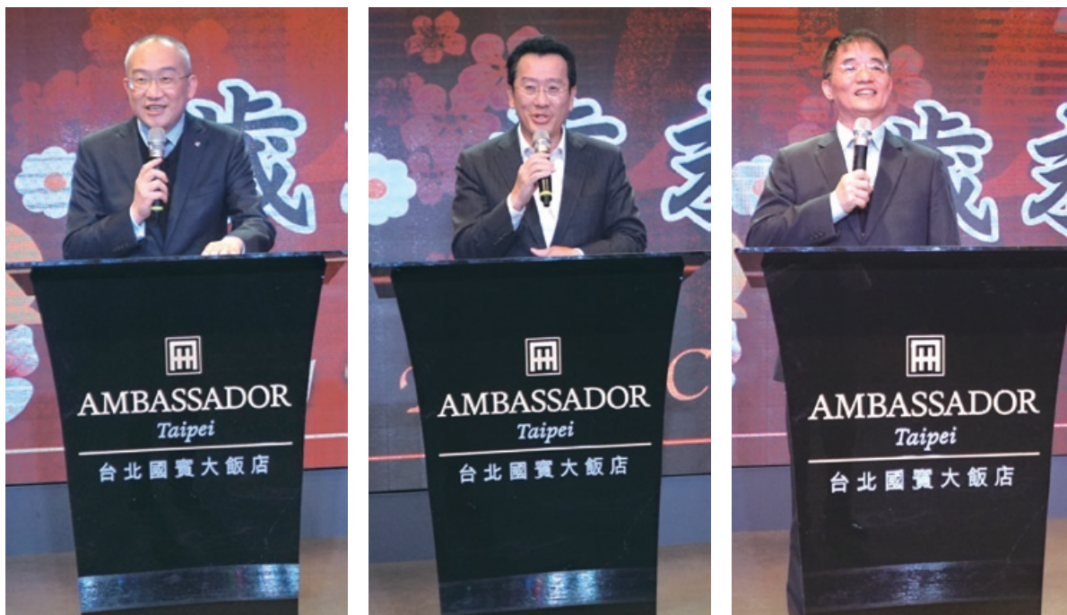
左起：期貨公會理事長糜以雍、金管會主任委員顧立雄、期交所董事長劉連煜

本公會歲末聯歡晚會於107年1月31日晚間假國賓大飯店2樓國際廳舉行，席間除本公會理監事、各委員會委員外，蒞臨貴賓尚有金管會顧主任委員立雄、鄭副主任委員貞茂、證期局王局長詠心及多位週邊董總，大家齊聚一堂，揮別昂首雞年、迎接旺旺狗年，共祝期貨市場蓬勃發展，更上層樓。