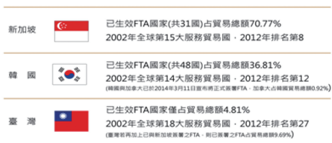
星、韓、臺已生效FTA占貿易額之比較表