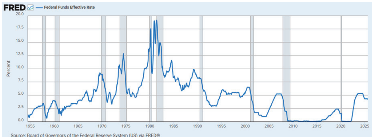
圖1、Fed Fund Rate

過去在高利率環境下，槓桿成本高、持倉壓力重，期貨操作多偏向避險性質；但隨著利率下降，資金成本降低，期貨市場重新展現效率與彈性。短線交易、跨期套利、甚至跨市場避險策略，都因流動性改善而更容易實現。這意味著不僅機構投資人，連一般投資人也能以更低的成本參與全球資金流向的變化。