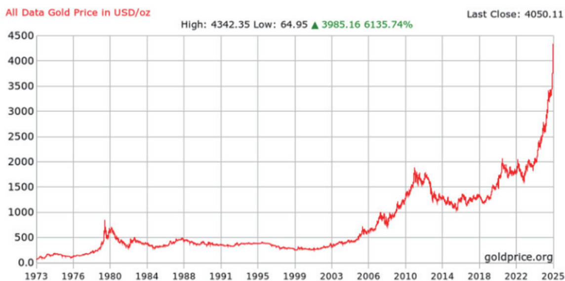
圖2、黃金價格過去50年走勢

值得注意的是，這一輪資金再平衡，並非像過去那樣只集中在少數市場或資產。AI帶來的生產力革命、能源轉型推動的新需求、以及地緣政治造成的供應重組，都使得資金分布更為分散。這也讓期貨市場成為「全球資金動向的縮影」，不論是標普500、台灣加權指數、歐元匯率，還是銅、黃豆、鋰礦，都在反映資金流向的即時節奏。