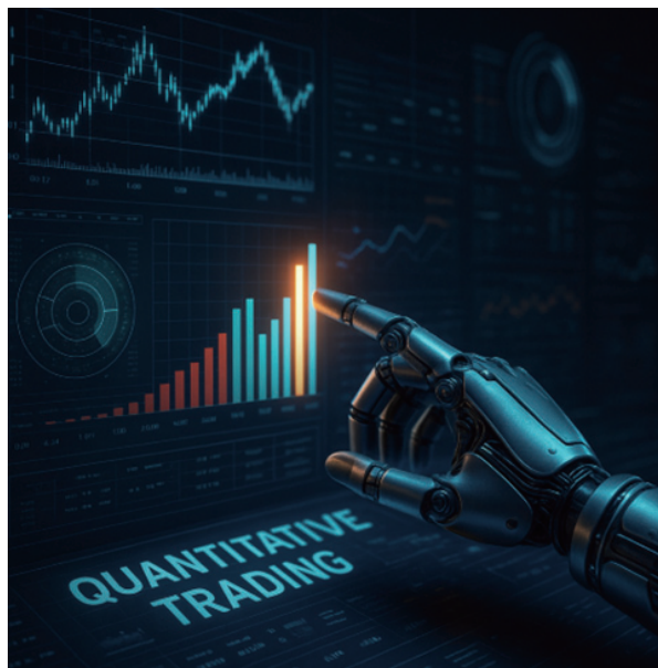
圖4、量化交易示意圖

對專業投資機構而言，AI也強化了風險管理的精度。以往風控多依賴人為經驗或單一指標，如波動率、保證金比例等；而現