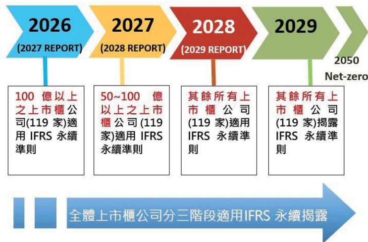
圖2、上市櫃公司IFRS永續揭露準則適用時程

6月26日正式發布永續揭露準則第S1號「永續相關財務資訊揭露之一般規定」(IFRS S1)及第S2號「氣候相關揭露」(IFRS S2)，規範企業揭露預期將於短、中、長期對其產生影響的永續及氣候相關風險與機會的資訊。金管會為接軌國際準則，旋即在8月17日正式發布「我國接軌IFRS永續揭露準則藍圖」，宣布我國上市上櫃公司應依資本額規模，以分階段方式接軌IFRS永續揭露準則(如圖2)，並宣布2026年為適用元年，未來上市櫃公司應於「股東會年報」揭露IFRS永續揭露準則規定的資訊，且須與財務報告同時公布，上市櫃公司股東會年報的發布時程須提前至最晚於年度終了後3個月或75日內公告申報影響上市櫃公司作業時程。