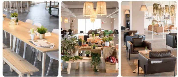
佳龍科技公司專注資源循環再生與企業社會責任ESG，新廠的員工餐廳，結合家居生活設計，提供員工舒適用餐與休息環境。

換個角度，企業避險經營主要是管理生產經營過程中對經營目標具不確定性影響的資產或負債，以穩定企業經營、降低經營損益波動。其中也涉及企業管理思維與避險會計的運作，尤其像我這樣的家族企業，要如何說服股東們改變他們沿習多年的經營模式，接受不同的營運經驗？我需要脈絡清晰與周全的布局，它不僅僅是技術、資金、管理，還有人才，條件有了，再串連起來，這樣公司的經營結構才會穩。如筆者所見，Ken董也已付諸行動從專業人才開始布局了。