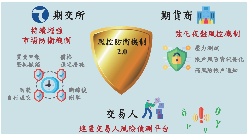
圖 3、期貨風控防衛機制 2.0 規劃