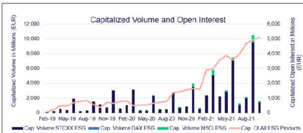
圖 2、EUREX ESG 衍生品歷史交易量，截至 09/30/2021

以發展最快的歐洲市場為例，2021年至今ESG衍生品的總交易量超過210萬口，合計交易金額353億歐元（約臺幣1.13兆），持倉量高達49億歐元（約臺幣1,572億），年成長率為200%（圖2）。由於這類合約參與者目前還屬於長期持有的機構投資者為主，因此交易量多集中於換季展倉月份（3、6、9、12月），今年9月份單月成交量就寫下58.3萬口的新高紀錄（圖3）。在2019年合約上市後至今短短不到三年時間，他的交易與持倉量已達原STOXX®歐洲600基準指數的20%（圖4） 3 。這對於任何新上市合約都是相當亮眼的資料，也可以看出市場對於ESG衍生品的強烈需求以及該指數合約的成功設計。