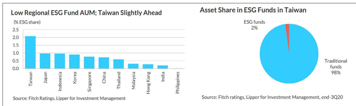
圖 1、亞洲 ESG ETF 2020 年發展規模，截至 2020 年第三季 ( https://www.fitchratings.com/research/fund-asset-managers/esg-emerges-as-investment-theme-in-taiwan-03-02-2021 )

是行之有年，每年遴選臺灣在永續經營治理領先的上市企業，作為全市場的標竿。而於2020年臺灣永續股價指數的發行及期貨合約的上市，更標榜臺灣在ESG經營投資標準上的新里程碑。除了資本市場的亮眼成績，投資人對於ESG投資的重視更是引領全球，2020年臺灣新上市的ESG基金檔次與募集規模位居全亞洲第三，截至2020年第三季合計發行規模達33億美元；而就基金發行量的占比，則居亞洲之首，更受到全球矚目。