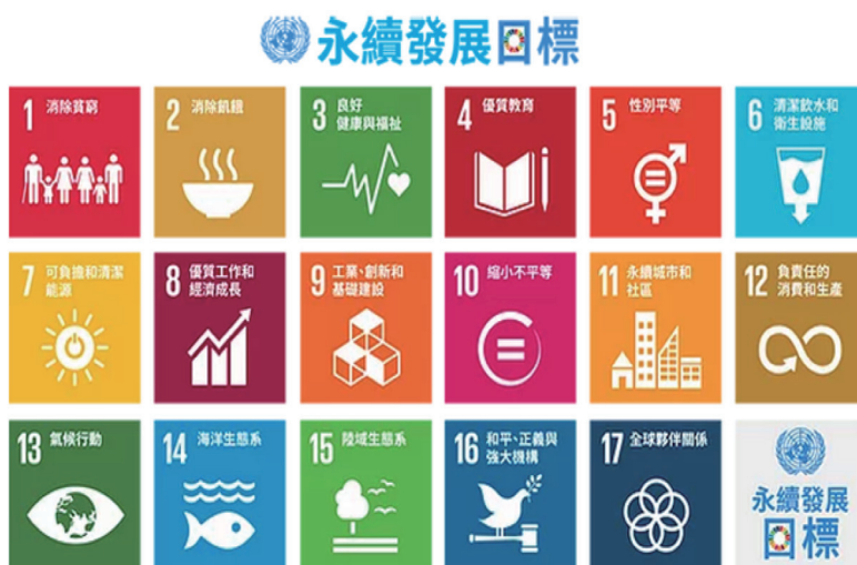
圖 1、涵蓋經濟、社會與環境三個面向的 17 項聯合國永續發展目標 (圖片來源：聯合國 | 正體中文化：循環臺灣基金會)