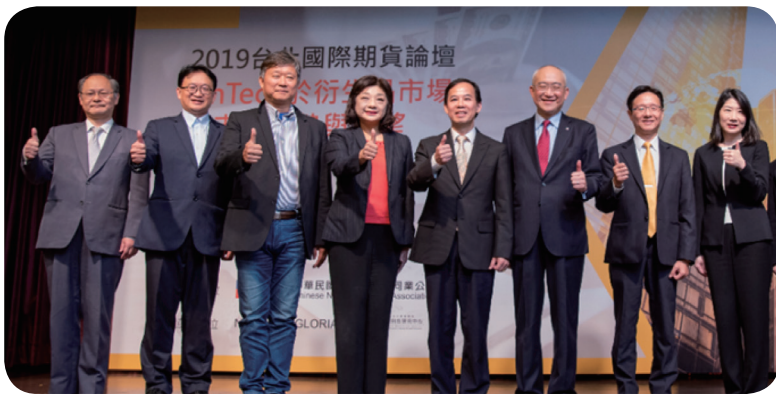
配合政府推動金融創新，期貨公會主辦或共同辦理多項宣導活動，108 年台北國際期貨論壇並以「FinTech 於衍生品市場之未來趨勢與展望」為主題進行探討。