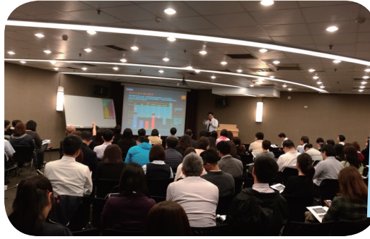
辦理巡迴宣導說明會