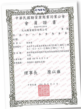
第一家槓桿交易商入會會員證書