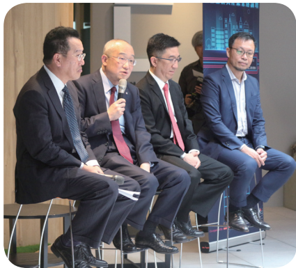
金融創新聚落論壇