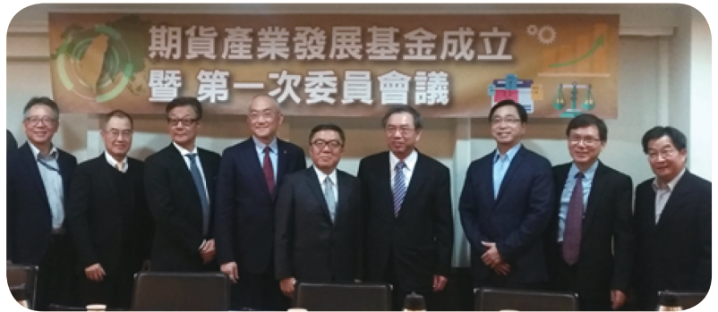
期貨業界為善盡社會責任，107 年底捐助款項成立「期貨產業發展基金」，辦理相關政令宣導、市場教育及制度推展等事宜。