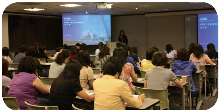
配合期貨商財報將於 102.1.1 起適用 IFRSs，為協助業者導入 IFRSs，自 100 年起辦理多場宣導課程。