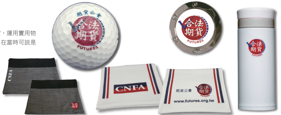
配合主管機關打擊地下期貨，運用實用物品辦理「合法期貨」宣導，在當時可說是金融業創舉

檔 號： 保存年限： 中華民國期貨業商業同業公會 函 地址：10688台北市大安區安和路一段27號12樓 聯絡人：張瓊文 聯絡電話：02-8773-7303 分機514 電子郵件：linda@cnfa.org.tw 傳 真：02-2772-8378 受文者：如行文單位 發文日期：中華民國106年7月4日 發文字號：中期貨字第106000288號 送別：普通件 密等及解密條件或保密期限： 附件： 主旨：「證券期貨業防制洗錢及打擊資恐內部控制要點」，業經金融監督管理委員會於106年6月28日以金管證發字第1060024432號令修正發布，檢送發布令(含附件)及修正總說明、對照表各一份，請 查照。 說明： 一、依據金融監督管理委員會106年6月28日金管證發字第1060024432號函辦理。 二、配合自揭要點及金融機構防制洗錢辦法之相關內容，本會刻正研議修正防制洗錢及打擊資恐恐怖主義注意事項範本，俟完成修正並函報主管機關備查後，將公告提供各公司參照辦理修正。 正本：全體會員公司 副本：金融監督管理委員會 配合「洗錢防制法」新制上路，主管機關發布「證券期貨業防制洗錢及打擊資恐內部控制要點」期貨公會主辦或共同辦理多項宣導活動，以協助會員強化風險基礎方法、落實 AML/CFT 相關規定，形塑防制洗錢及打擊資恐之法遵文化。