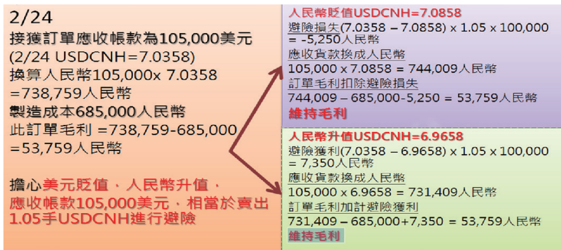
圖4、出口商外匯避險情境分析

元，應收帳款日期為6個月後，而中間的製造與營業成本為685,000人民幣，以2月24日美元兌離岸人民幣匯率為7.0358，換算訂單貨款為 105,000 \times 7.0358 = 738,759 人民幣，此出口商的毛利為 738,759 - 685,000 = 53,759 人民幣；為了維繫毛利，擔心美元貶值，人民幣升值，因此賣出1.05手USDCNH進行避險。圖4. 針對USDCNH不同匯率升貶進行情境分析，可以看出，利用外匯保證金進行避險，無論人民幣升貶，都可以對於維持毛利有一定的效果。即使應收帳款訂單為105,000美元，也可以利用外匯保證金的特性，讓避險不會有太多損失。