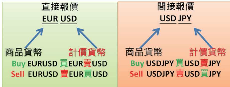
圖 3、直接報價與間接報價比較 圖片製作：群益期貨

對於外匯初步了解之後，再來聊聊外匯交易產品。外匯產品有很多，包括外匯現貨、外匯ETF、外匯期貨、遠期外匯（DF）、外匯選擇權（FX Options）、外匯交換（FX Swap）…等商品，外匯保證金也是其中一種商品，主要交易標的為即期匯率（spot），其具有以下幾點特性：